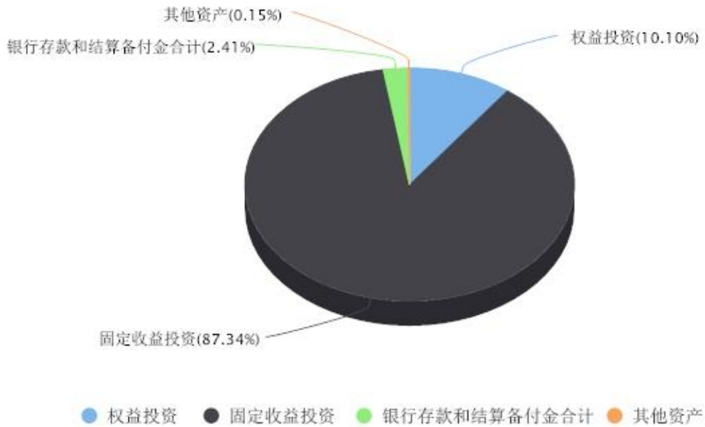
投资组合资产配置图表 数据截止日期:2024年03月31日