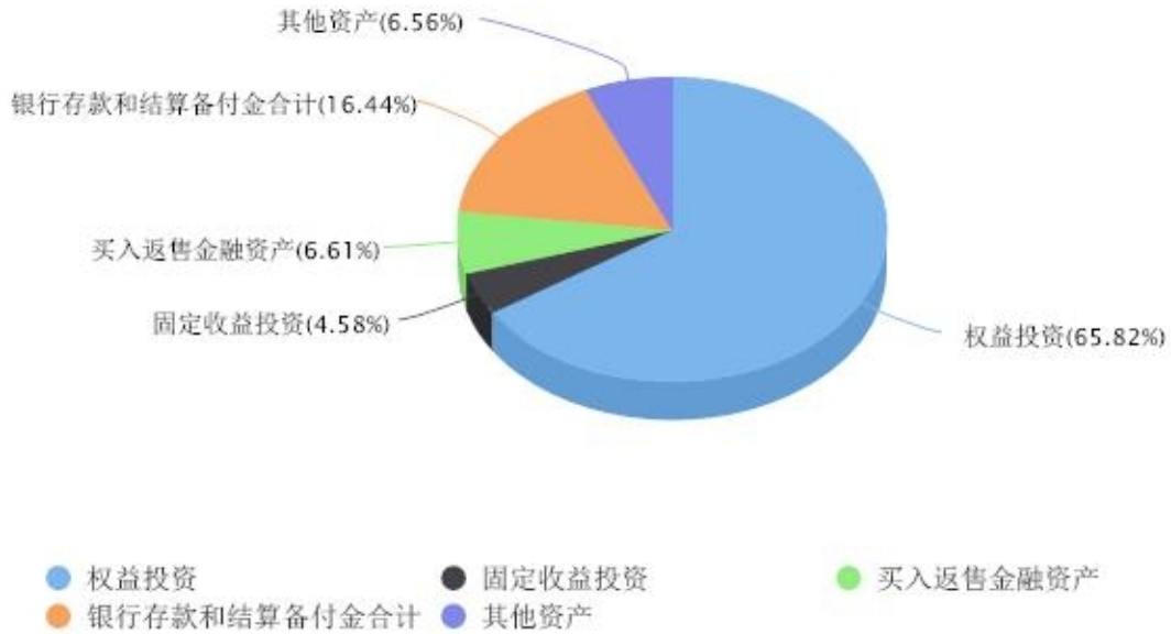
投资组合资产配置图表 数据截止日期:2024年12月31日