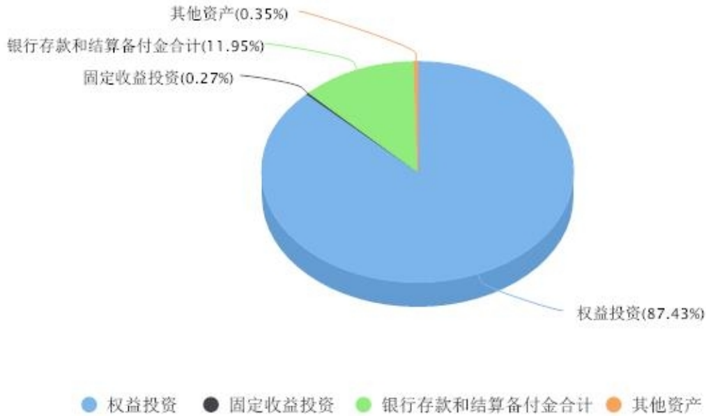
投资组合资产配置图表 数据截止日期:2024年06月30日