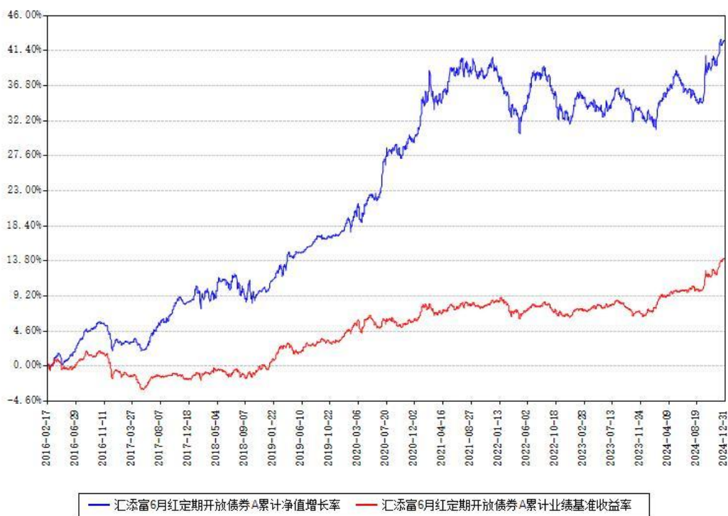
汇添富6月红定期开放债券A累计净值增长率与同期业绩基准收益率对比图