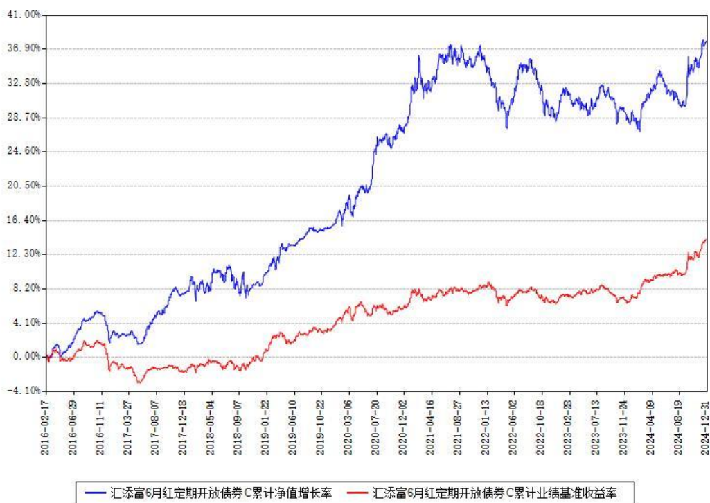
汇添富6月红定期开放债券C累计净值增长率与同期业绩基准收益率对比图