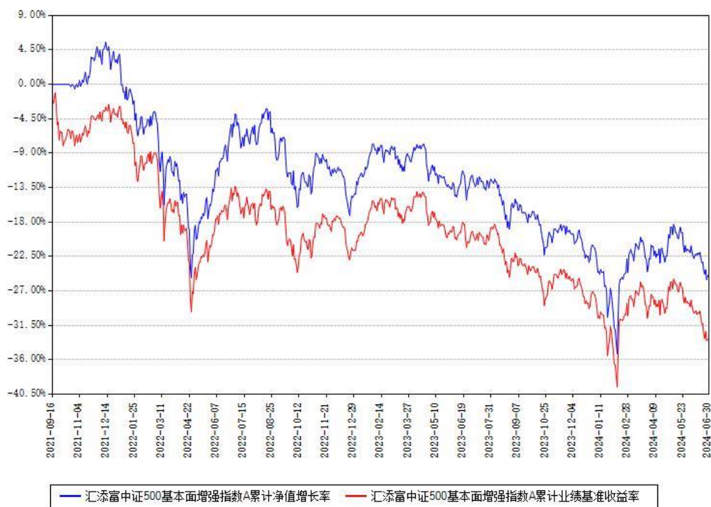
汇添富中证500基本面增强指数A累计净值增长率与同期业绩基准收益率对比图