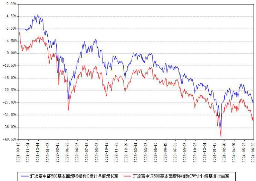
汇添富中证500基本面增强指数C累计净值增长率与同期业绩基准收益率对比图